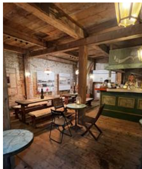
Museum och PopUp café