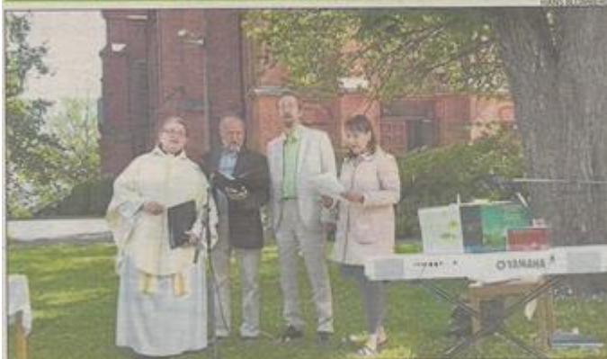
Sunnuntaina vietettiin ruotsinkielistä jumalanpalvelusta kirkonmäellä yhteistyönä Sipoon ruotsalaisen seurakunnan ja Sibbo Hembygdsföreningin välillä. Seurakunta tarjosi kirkkokahvit ja maatalousmuseo oli auki yleisölle.