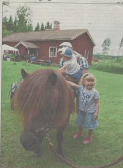
Miä Tadicin pöytä Pöytä-pöytä Sibbögårdenin kotiseutumuseossa. Mukana olivat myös pöytä ja jättäjäpöytä.

Sibbögårdenin kotiseutumuseo on Sipoon maatalousmuseo, jossa on kaneja, kaneja, lampaita ja poneja. Ohjelmassa oli lisäksi jättäjäpöytä.