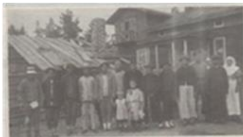
ARBETARE. 800 tvångsarbetsflyttade kinesiska arbetare jobbade i Sibbo för hundra år sedan.