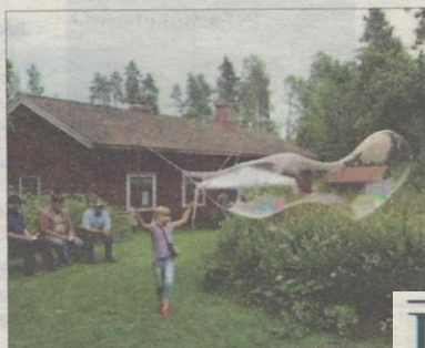
EVENEMANG. 4H i Sibbo ska också i sommar på Sibbesgården.

- Vi vill se till att kommunen inte fördärvar det Sibbo vi kommit att älska när nya bostättningsområden planläggs i den växande kommunen. Vi ser också att det är de hem-